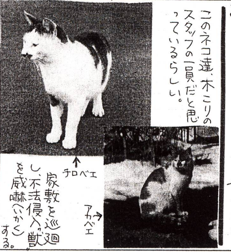
このネコ達、木こりのスタッフの飼育だと思つてらるらしい。 サイトウ

この生物が棲めない大川(一級河川)を元のまじいな水に戻してもらいたい。今年には私事として蔵王川の強酸性(pH三・六)水を水槽に汲み入れ、イーエム微生物による中和で小魚を入れての実験を試みる積りでいるが何としても産学官協同の技術開発を切に願いたいところである。