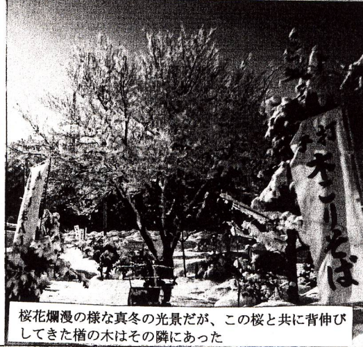
桜花爛漫の様な真冬の光景だが、この桜と共に背伸びしてきた榎の木はその隣にあった

夏場は昆虫類の住み家だったり葉枝の中に小鳥が宿りさえずった榎の木。店とオープンする数年前「榎」の苗木として小倉の山口家から載いたものだった。それが「榎」になく「榎」に变身してしまつた訳だがそのまま大事に育ててきた積りだ。お客さんの子供達はドングリの木などと言って実を拾い楽しんでくれた。榎。それが四十八年にして榎枯れの被害にあつてしまった。